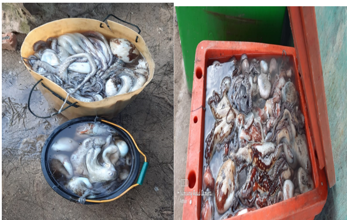
Gambar 1. Gurita hasil dari para nelayan di Gampong Gugop

semakin pesat (Marzuki et al., 2021). Melihat potensi yang dimiliki oleh mitra seperti di Gampong Gugop Kecamatan Pulo Aceh dari hasil laut sebagai sumber daya alam yang sangat tentunya hal ini membuka peluang yang besar bagi mitra atau masyarakat seperti gurita, selama ini gurita hanya dijual mentah dan tidak diolah atau dikembangkan dalam jenis produk apa pun. Dalam suatu produksi barang maka diperlukan perhitungan harga pokok dari produksi yang tepat hal ini berguna untuk harga jual suatu produk yang ditentukan oleh harga pokok produksi. Dengan harga jual yang terlalu tinggi maka juga akan melemahkan daya saing dari suatu usaha dan begitu juga sebaliknya (Aini, 2022).