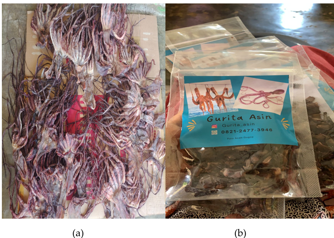
Gambar 1. Gurita yang telah kering (a), Gurita asin telah di beri stiker (b)