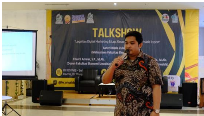
Gambar 2. Narasumber Menyampaikan Materi

berdasarkan informasi keuangan yang dihasilkan. Para peserta diajak untuk menganalisis laporan keuangan sederhana guna mengidentifikasi tren bisnis, menilai kesehatan keuangan, dan merencanakan langkah-langkah strategis ke depan (Lestari & Wicaksono, 2023). Selain itu, partisipan juga diajarkan tentang cara memanfaatkan fitur-fitur khusus dalam aplikasi Buku Warung, seperti pelacakan utang-piutang, stok barang, dan pencatatan pajak (Muzakki et al., 2022). Dengan demikian, pelaku usaha dapat mengoptimalkan fungsi aplikasi untuk meningkatkan efisiensi operasional mereka.