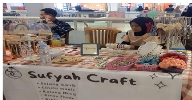
Gambar 1. UMKM Peserta Pelatihan

Adapun beberapa nama usaha yang mengikuti pelatihan ini adalah Sufyah Craft, Coffe Sehat, Juragan Singkong, Kiw Cheese, Kim Dimsum, Midori Parfume, Banana Lumer (Blumer), dan Bite me.