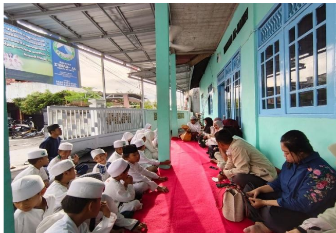
Gambar 2. Persiapan Peserta

Kegiatan Pengabdian dilaksanakan dengan terlebih dahulu persiapan oleh tim pengabdian di Yayasan Al Kahfi Cabang Mataram. Persiapan dilakukan untuk memastikan kegiatan pengabdian berjalan lancar, termasuk persiapan peserta agar siap mengikuti kegiatan dengan seksama. Selain itu, tim memastikan kesiapan teknis seperti perangkat pengeras suara dan pengaturan tempat duduk agar materi yang disampaikan dapat diterima dengan jelas peserta. Koordinasi akhir dengan pengurus yayasan juga dilakukan guna menciptakan suasana yang kondusif dan partisipatif selama rangkaian acara berlangsung.