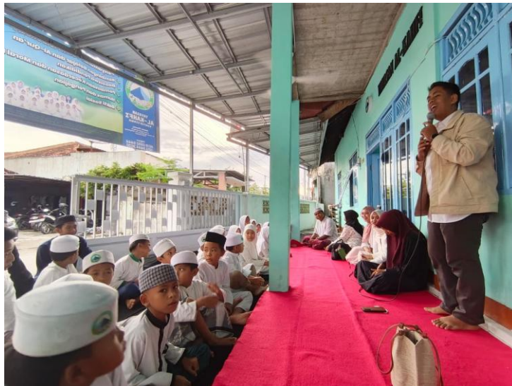
Gambar 3. Ceramah Reflektif

Kemudian pelaksanaan pengabdian dilakukan dengan metode ceramah reflektif dari tim pengabdian. Ceramah reflektif ini mengajak peserta untuk memahami tentang literasi keuangan Syariah dan pentingnya menabung dalam jangka Panjang.