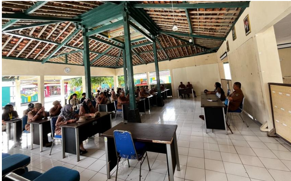
Gambar 2. Antusiasme Masyarakat Desa Kenteng, Kecamatan Ponjong, Gunung Kidul, Yogyakarta dalam Mengikuti Penyuluhan Hukum

Ragam kegiatan yang dilaksanakan meliputi penyuluhan hukum secara dialogis, diskusi interaktif, serta konsultasi terbatas mengenai persoalan pengelolaan aset tanah permukiman. Bentuk aksi teknis difokuskan pada peningkatan pemahaman masyarakat terkait hak dan kewajiban hukum, prosedur pendaftaran tanah, serta langkah-langkah preventif untuk meminimalisasi potensi sengketa. Melalui pendekatan komunikatif dari para narasumber, masyarakat lebih mudah memahami konsekuensi hukum dari pengelolaan tanah yang tidak tertib serta pentingnya kepastian hukum bagi keberlanjutan aset permukiman.