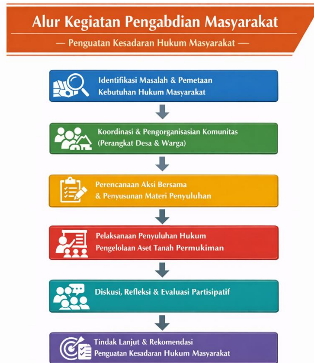
Gambar 1. Alur Pengabdian Masyarakat