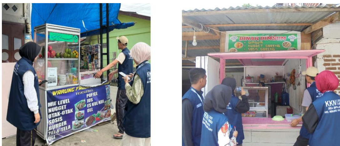
Gambar 1. Tahap Survei dan Identifikasi UMKM di Desa Sempajaya Oleh Tim Branding Berkah

Sosialisasi diawali dengan melakukan survei ke beberapa UMKM. Mahasiswa mendatangi tempat produksi UMKM secara door to door . Hal ini bertujuan untuk mengetahui maupun mencari tahu keadaan UMKM yang telah berjalan sebelumnya dan kendala-kendala yang ada pada UMKM di Desa Sempajaya. Kegiatan survei ini dilakukan untuk memperoleh data yang lebih akurat melalui komunikasi langsung dengan pelaku usaha dan observasi di lokasi usaha (Setiawan et al., 2024).