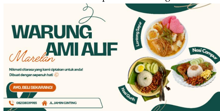
Gambar 3. Desain Spanduk Warung Ami Alif