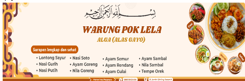
Gambar 2. Desain Spanduk Warung Pok Lela

Tahap ini merupakan bentuk akhir dari proses perancangan spanduk yang telah melalui tahapan identifikasi kebutuhan UMKM, pengumpulan informasi identitas usaha, diskusi partisipatif dengan pelaku UMKM, serta proses revisi dan validasi desain. Setiap desain spanduk disusun dengan memperhatikan karakteristik dan keunikan masing-masing usaha, seperti pemilihan warna khas produk, jenis font yang mudah dibaca, serta penempatan elemen visual yang proporsional. Desain spanduk yang dihasilkan menampilkan identitas usaha secara lebih profesional dan menarik, mencakup nama usaha, jenis produk, kontak pemesanan, logo, serta elemen promosi sederhana. Desain ini berfungsi sebagai media komunikasi visual antara pelaku UMKM dan konsumen, sekaligus memperkuat citra usaha secara keseluruhan. Berikut merupakan hasil desain spanduk yang telah dibuat oleh tim Branding Berkah untuk masing-masing pelaku UMKM Desa Sempajaya: