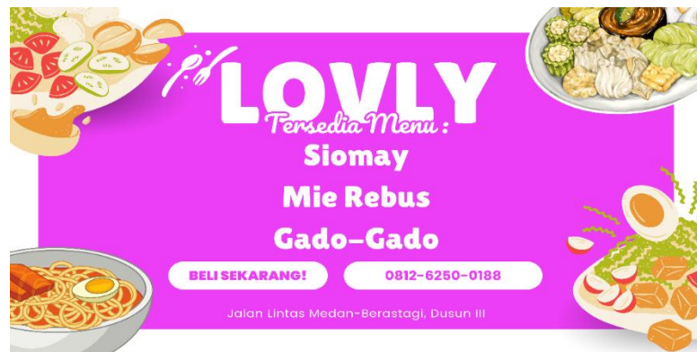
Gambar 4. Desain Spanduk Lovly