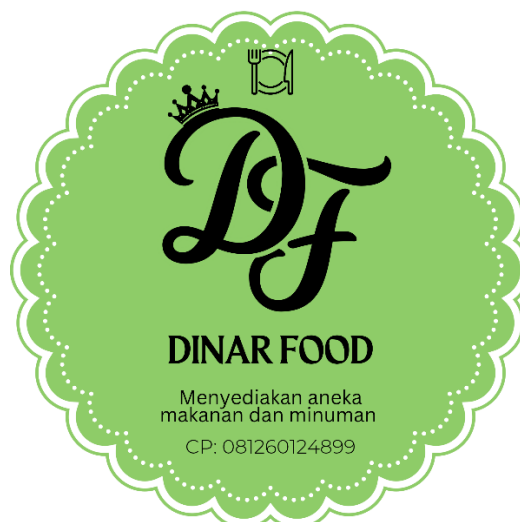
Gambar 8. Label Dinar Food