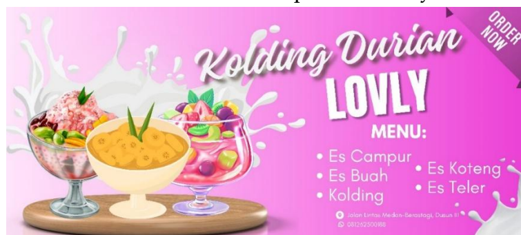
Gambar 5. Desain Spanduk Kolding Lovly