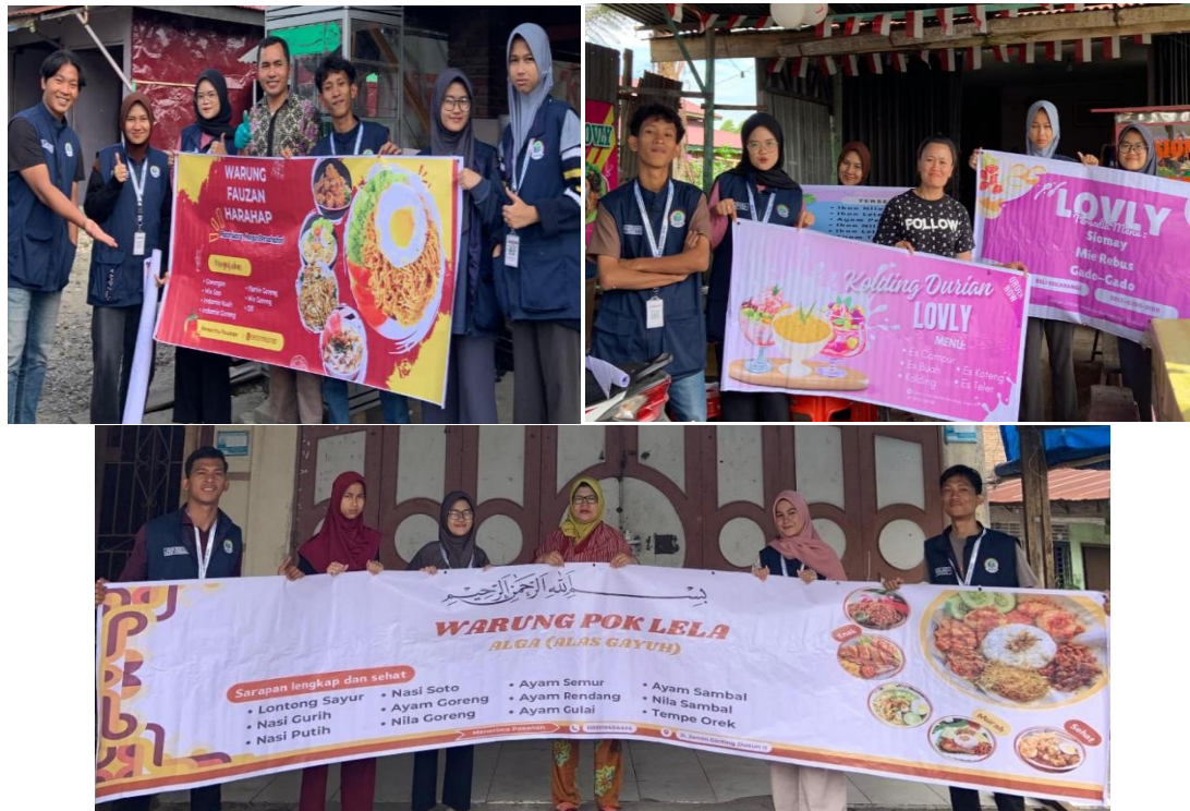
Gambar 9. Pemasangan Spanduk