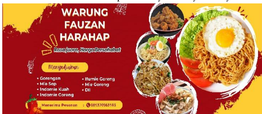
Gambar 7. Desain Spanduk Warung Fauzan