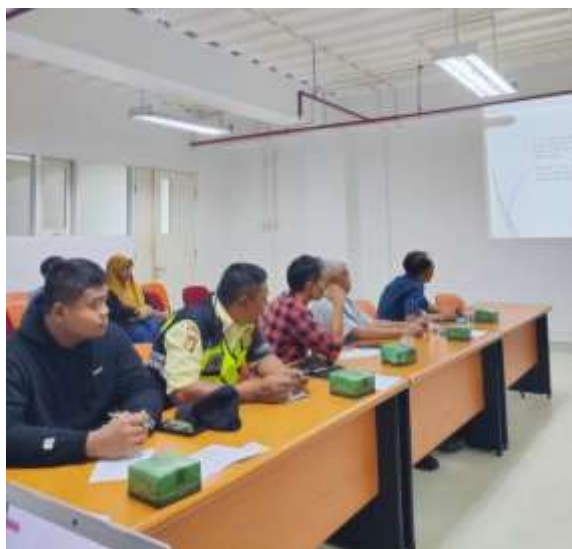
Gambar 3. Antusias peserta pelatihan

Antusiasme peserta terlihat jelas dari banyaknya pertanyaan yang diajukan selama sesi pelatihan, terutama terkait permasalahan keuangan yang sedang mereka hadapi, seperti penggunaan pinjaman online (pinjol) yang semakin marak dan sering kali meresahkan. Pada Gambar 3 terlihat peserta memperhatikan pelaksanaan seminar tersebut. Peserta mengungkapkan kekhawatiran terhadap risiko yang ditimbulkan oleh pinjaman online , mulai dari bunga yang sangat tinggi, tenor yang singkat, hingga proses penagihan yang memberatkan. Beberapa peserta juga menceritakan pengalaman pribadi mereka, di mana kemudahan akses terhadap pinjol tanpa pemahaman yang memadai menyebabkan kesulitan finansial, seperti utang yang menumpuk dan sulit untuk dilunasi. Sejalan dengan temuan Mberia & Wachira (2021), rendahnya pemahaman tentang literasi keuangan berkontribusi pada peningkatan utang konsumtif di kalangan masyarakat berpenghasilan rendah hingga menengah. Dalam konteks pinjaman berbunga tinggi, penelitian Seldal & Nyhus (2022) juga menunjukkan bahwa kurangnya literasi keuangan, terutama di kalangan generasi muda, serta perubahan perilaku keuangan akibat meningkatnya penggunaan metode pembayaran digital seperti pembayaran melalui ponsel, dapat meningkatkan risiko kerentanan finansial.