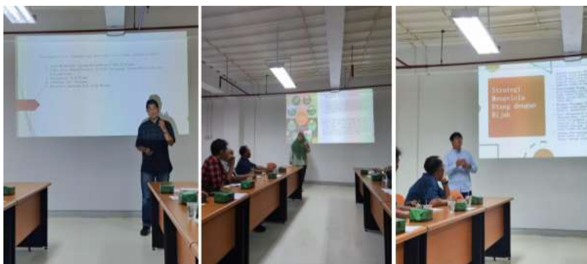
Gambar 1. Penyampaian Materi Pelatihan