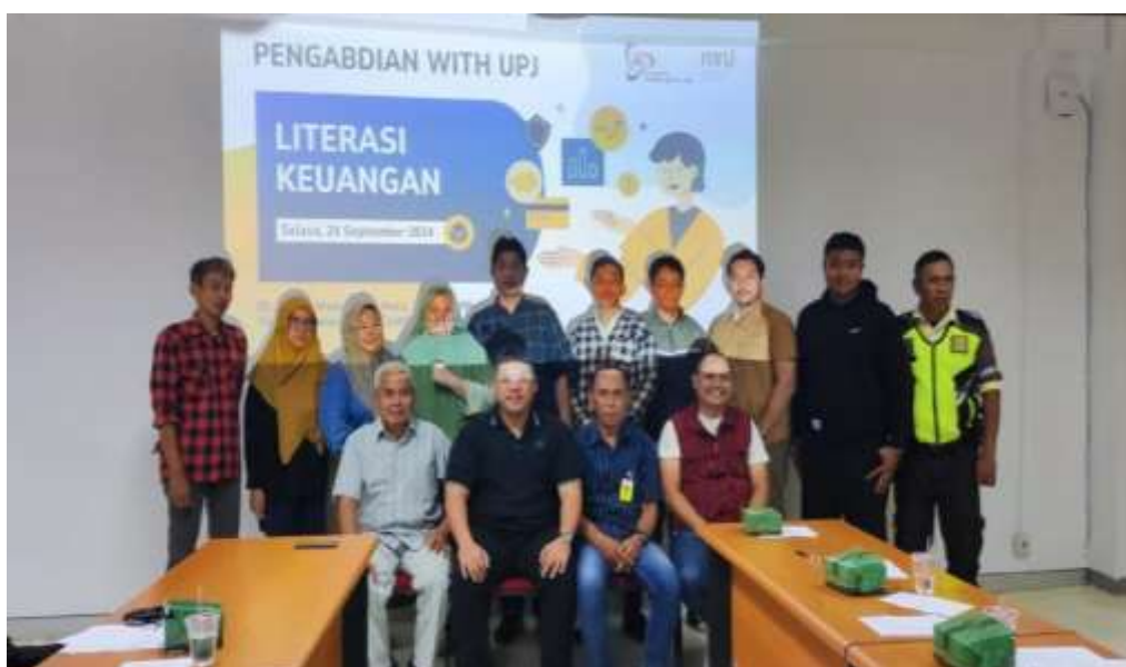
Gambar 5. Foto bersama peserta Pelatihan

pelatihan ini. Banyak peserta mengungkapkan rasa terima kasih mereka atas ilmu yang diberikan dan berharap kegiatan serupa dapat diadakan kembali di masa depan dengan topik yang lebih mendalam. Sebagai simbol kebersamaan dan keberhasilan acara, seluruh peserta dan panitia berkumpul untuk sesi foto bersama seperti pada gambar 5. Foto ini tidak hanya menjadi dokumentasi resmi kegiatan, tetapi juga sebagai pengingat akan kolaborasi positif yang telah terjalin antara tim pengabdian masyarakat dan warga RT.03 RW.04 Kelurahan Sawah Baru.