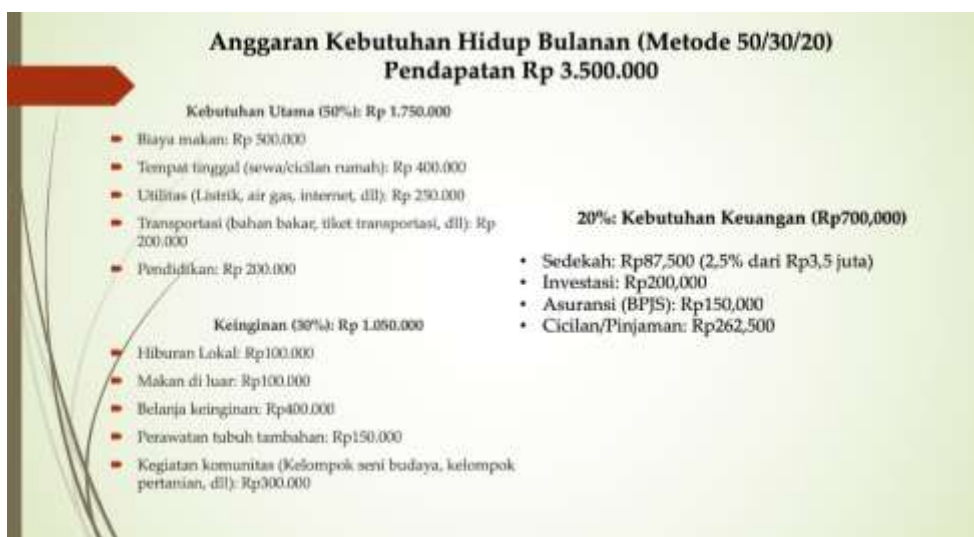
Gambar 2. Simulasi penyusunan anggaran metode 50/30/20

Pendekatan ini didukung oleh penelitian Nugraha et al. (2023), yang menunjukkan bahwa simulasi praktis mampu meningkatkan literasi keuangan dan mendorong perubahan perilaku positif dalam pengelolaan keuangan. Selain itu, beberapa peserta mengungkapkan rencana mereka untuk mencoba investasi sederhana atau memperbaiki kebiasaan pengeluaran, sesuai dengan temuan Lusardi & Mitchell (2014), yang menekankan bahwa literasi keuangan dapat memotivasi individu untuk mengambil langkah keuangan yang lebih bijak.